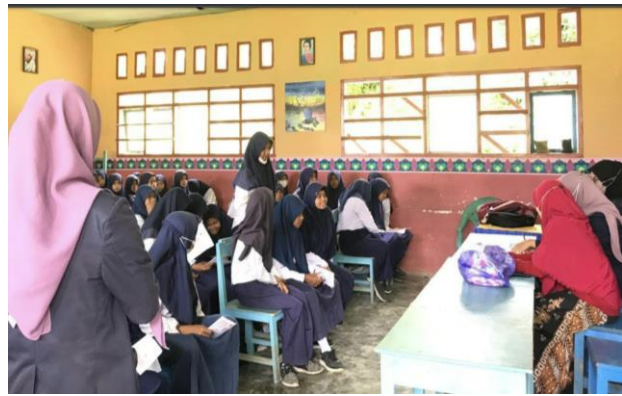
Gambar 2: Tanya Jawab