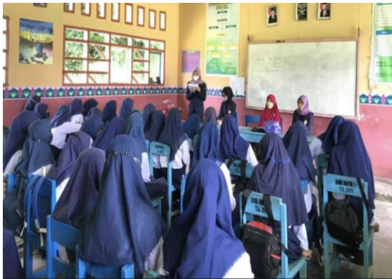
Gambar 1; Memberikan Edukasi MHM

Kegiatan pengabdian masyarakat ini diawali dengan pemberian kuesioner (pretest) yang berisi pertanyaan tentang bagaimana mengelola kebersihan diri remaja putri saat menstruasi. Selanjutnya diberikan edukasi menggunakan leaflet, ceramah, tanya jawab dan demonstrasi mencuci pembalut bekas pakai sebelum dibuang. Di akhir kegiatan diberikan kembali kuesioner posttest untuk menilai pemahaman remaja tentang kebersihan saat menstruasi.