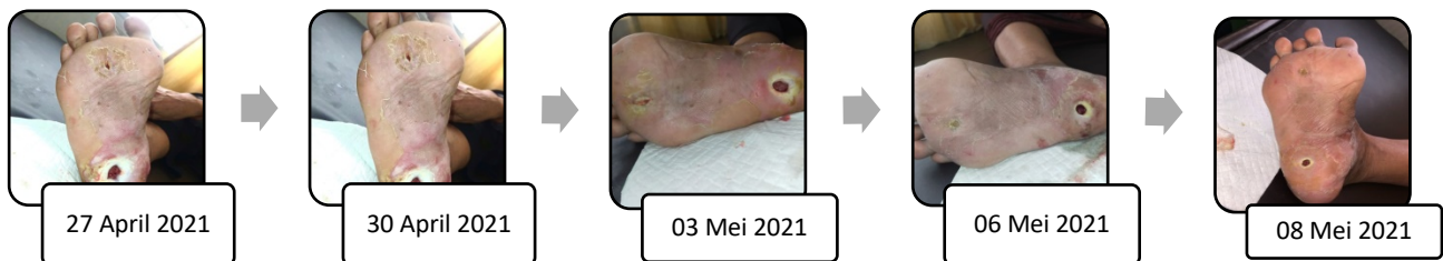
Gambar 1. Perbaikan ulkus diabetik pada Ny.N tanggal 27 April-08 Mei 2021

Setelah penerapan dilakukan observasi derajat ulkus diabetik responden menggunakan Lembar observasi derajat klasifikasi ulkus diabetik, pada responden pertama yaitu Ny.N, di hari ke-12 tanggal 08 Mei 2021 pukul 15.00 WIB, setelah diberikan penerapan latihan range of motion (ROM) ekstremitas bawah didapatkan hasil derajat 1 ulkus diabetik pada kaki kanan. Pada responden kedua yaitu Ny.T, Pada hari ke-12 tanggal 08 Mei 2021 pukul 14.00 WIB, setelah dilakukan penerapan latihan range of motion (ROM) ekstremitas bawah didapatkan hasil derajat 1 ulkus diabetik pada kaki kiri.