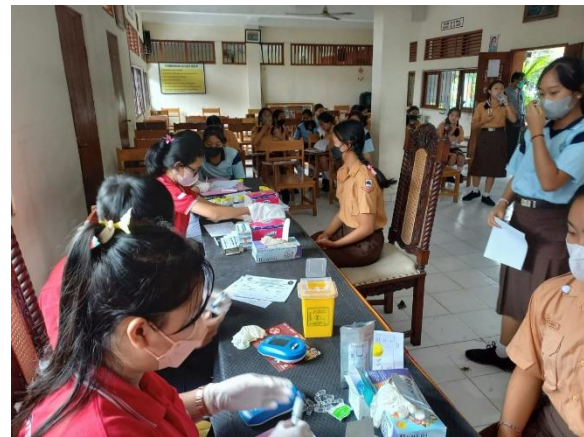
Gambar 3. Pemeriksaan kadar Hb dan protein urin

Tingkat pengetahuan remaja putri tentang anemia diketahui melalui kuesioner (posttest) yang dibagikan setelah pemberian penyuluhan kesehatan dilakukan. Dari hasil yang diperoleh sebesar 94% (32 responden) memiliki tingkat pengetahuan yang baik dan 6% (2 responden) memiliki tingkat pengetahuan cukup tentang anemia. Hasil ini dapat dilihat pada Tabel 2.