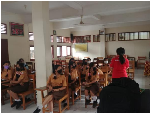
Gambar 2. Penyampaian materi tentang anemia