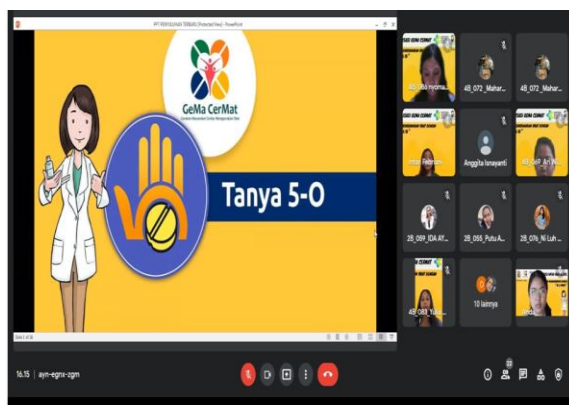
Gambar 2. Penyampaian materi tentang Tanya 5 Lima O. 5 O yang harus ditanyakan oleh responden saat menerima obat, berupa apa nama dan kandungan obat, khasiat, dosis, cara menggunakan dan efek samping obat.