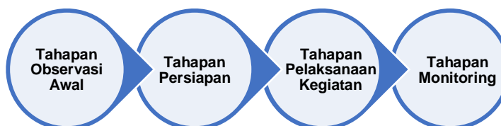
Gambar 1. Bagan Alir Tahapan Kegiatan pada Sosialisasi Gema Cermat

Salah satu strategi untuk perubahan perilaku adalah pemberian informasi guna meningkatkan pengetahuan sehingga timbul kesadaran yang pada akhirnya orang akan berperilaku sesuai dengan pengetahuannya tersebut. Salah satu upaya pemberian informasi yang dapat dilakukan adalah dengan penyuluhan (Lubis et al., 2013).