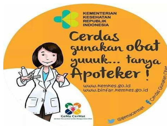
Gambar 5. Slogan Gema CerMat. Slogan untuk masyarakat tahu kepada siapa harus menanyakan tentang obat.

Sesi tanya jawab yang dilakukan dapat dijadikan sebagai pendorong dan pembuka jalan bagi masyarakat khususnya remaja pada sekaa Truna Truni untuk mengetahui dan memahami lebih lanjut tentang penggunaan obat dengan baik dan benar. Pada sesi tanya jawab, respon yang didapatkan sangat baik yang terlihat dari banyaknya pertanyaan yang disampaikan kepada pemateri. Hal tersebut menunjukkan hasil refleksi/bentuk keingintahuan masyarakat terhadap materi tersebut yang dapat menimbulkan dampak positif. Terdapat peserta yang bertanya dengan pertanyaan yang bervariasi dan diajukan secara serius saat sesi tanya jawab. Peserta juga dapat merangkum materi dengan baik dan menyampaikannya kembali secara jelas. Hal ini dapat menunjukkan antusiasme peserta penyuluhan terhadap materi yang diberikan. Pihak Sekaa Teruna Teruni Panji Semerang menerima penyuluhan dengan sangat baik dan diharapkan untuk ada penyuluhan kembali di kemudian hari.