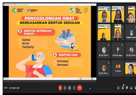
Gambar 3. Penyampaian materi tentang Tanya Lima O Dalam Tema Penggolongan Obat. Penggolongan obat yang berdasarkan bentuk sediaan, ada padat, cair, setengah padat dan gas.