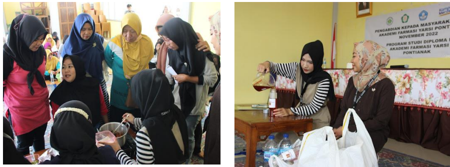
Gambar 3 Proses pelatihan dan pendampingan pembuatan sirup olahan kayu secang, perasan buah jeruk sambal, dan kulit jeruk sambal

Luaran hasil kegiatan PkM ini adalah berupa peningkatan pengetahuan dan keterampilan masyarakat dengan meningkatkan nilai efisiensi dan kemanfaatan hasil perkebunan masyarakat, yaitu jeruk sambal dan kayu secang, sehingga mitra dapat memperoleh pengetahuan dan berperan aktif dalam mengatasi kasus stunting.