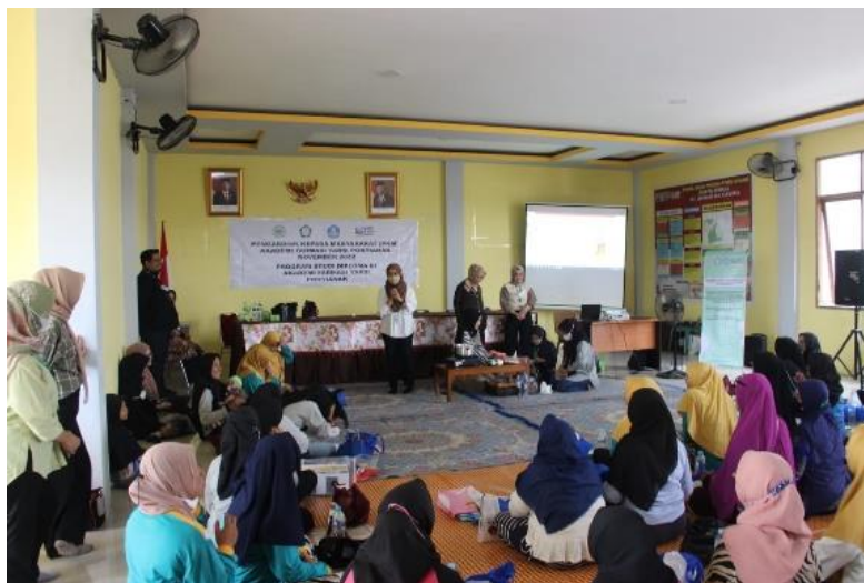
Gambar 2 Proses pemberian materi

sebagai asupan gizi yang dibutuhkan pada penanganan kasus stunting (Gambar 2). Asupan gizi berupa makronutrien dan mikronutrien berdampak pada kejadian stunting pada balita, dimana asupan gizi tersebut dipengaruhi sejak dalam kandungan (Ayuningtyas et al., 2018). Kayu secang dan jeruk sambal mengandung senyawa mikronutrien berupa kandungan senyawa bioaktif. Kayu secang dikenal sebagai tanaman sumber antioksidan, berupa senyawa fenolik dan flavonoid (Badami et al., 2003), serta senyawa brazilin dan brazilein yang menjadi penciri kayu secang (Nirmal & Panichayupakaranant, 2015). Sementara itu jeruk sambal memiliki kandungan mikronutrien seperti flavonoid, alkaloid, saponin, tannin, terpenoid, steroid, dan vitamin C (Widyasari et al., 2020), serta bagian kulit jeruknya juga kaya akan senyawa volatile kompleks, yaitu asam hidroksisinamat umum (caffeic, p-coumaric, asam ferulic dan sinapic) (Cheong et al., 2012). Sementara itu, kandungan makronutrien pada jeruk sambal adalah lemak dan karbohidrat (Kristiandi & Sitompul, 2020).