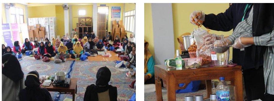
Gambar 3 Proses pelatihan dan pendampingan pembuatan sirup olahan kayu secang, perasan buah jeruk sambal, dan kulit jeruk sambal

Kegiatan workshop dimulai dengan pelatihan dan pendampingan pengolahan jeruk sambal dan kayu secang oleh tim PkM Kepada mitra. Mita dibagi menjadi lima kelompok (10 orang perkelompok). Jeruk sambal sebelumnya dipisahkan antara buah dan kulit buahnya. Pelatihan pembuatan sirup dilakukan melalui demonstrasi dilanjutkan dengan praktek langsung oleh mitra untuk memberikan pengalaman dan pengetahuan. Kegiatan dilanjutkan dengan pengemasan sirup olahan kayu secang dan jeruk sambal. Semua kegiatan dilakukan melalui penerapan cara pembuatan yang baik untuk mempertahankan mutu sirup yang dihasilkan, seperti yang terlihat pada Gambar 3.