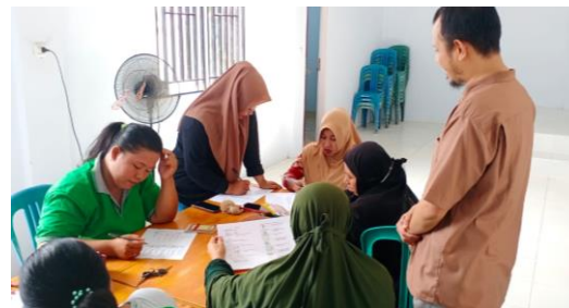
Gambar 5 Pengisian Post test

Gambar 3 menunjukkan bahwa juga dilakukan penyampaian materi tentang stunting. Stunting merupakan masalah gizi kronis pada anak-anak yang ditandai dengan pertumbuhan fisik yang terhambat. Penyuluhan tentang stunting penting dilakukan untuk meningkatkan kesadaran masyarakat mengenai masalah ini dan mengajarkan cara-cara mencegahnya. Materi yang disampaikan mungkin termasuk informasi mengenai pentingnya gizi yang seimbang pada masa pertumbuhan anak dan strategi pencegahan stunting (Ramadhan, Entoh, et al., 2022; Ramadhan, Nurfatimah, et al., 2022).