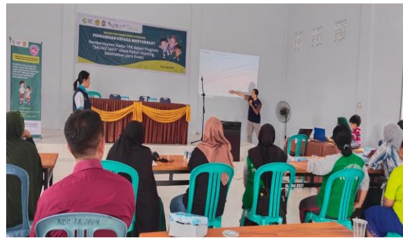
Gambar 3 Penyampaian materi tentang stunting

Peningkatan pengetahuan berbasis pelatihan dapat menggunakan berbagai cara, seperti metode ceramah, diskusi, dan praktikum yang diberikan oleh tenaga kesehatan kepada para kader. Peningkatan pengetahuan kader dapat dilakukan dengan cara metode ceramah, simulasi dalam deteksi dini stunting menggunakan metode smart chart , leaflet serta stimulasi tumbuh kembang anak (Damayanti, Astuti, Istiana, Kusumawati, & Janah, 2023; Mediani, Nurhidayah, & Lukman, 2020; Ramadhan, Maradindo, Nurfatimah, & Hafid, 2021)