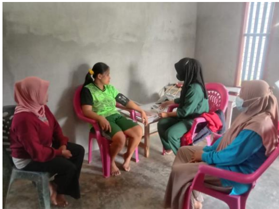
Gambar 6 Surveilans ke keluarga berisiko stunting