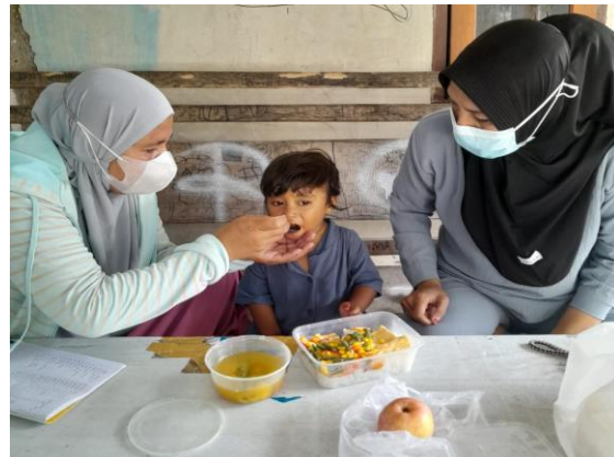
Gambar 7 Pemberian Makanan Tambahan pada balita stunting oleh TPK

Sejalan dengan kegiatan pengabdian yang dilakukan di 3 wilayah yang berbeda yaitu, Sleman, Bengkulu, dan Kupang dengan metode edukasi, pelatihan, dan simulasi menemukan bahwa kegiatan PKM melalui pelatihan pengukuran status gizi baduta dapat meningkatkan pengetahuan ibu hamil, ibu yang memiliki baduta, dan kader posyandu sebagai khalayak sasaran (Isni & Dinni, 2020; Yuliantini, Debora, & Ludji, 2022)