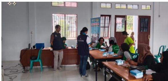
Gambar 4 Diskusi dan Tanya Jawab

Peningkatan pengetahuan berbasis pelatihan dapat menggunakan berbagai cara, seperti metode ceramah, diskusi, dan praktikum yang diberikan oleh tenaga kesehatan kepada para kader. Peningkatan pengetahuan kader dapat dilakukan dengan cara metode ceramah, simulasi dalam deteksi dini stunting menggunakan metode smart chart , leaflet serta stimulasi tumbuh kembang anak (Damayanti, Astuti, Istiana, Kusumawati, & Janah, 2023; Mediani, Nurhidayah, & Lukman, 2020; Ramadhan, Maradindo, Nurfatimah, & Hafid, 2021)