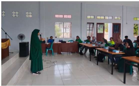
Gambar 2 Penyampaian materi tentang Tim Pendamping Keluarga