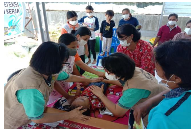
Gambar 3 Tim sedang melakukan praktik pengukuran panjang badan bayi