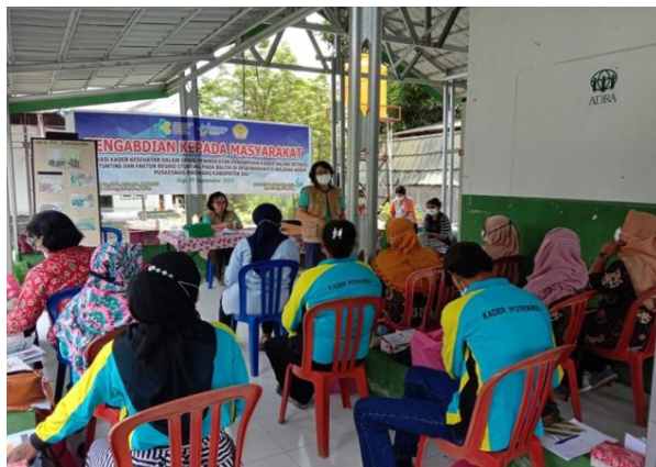
Gambar 2 Tim PkM sedang melakukan penyuluhan

Tujuan pelaksanaan PkM ini yaitu untuk meningkatkan pengetahuan dan sikap kader kesehatan tentang deteksi dini stunting dan faktor risiko stunting serta meningkatkan keterampilan kader dalam upaya deteksi dini stunting.