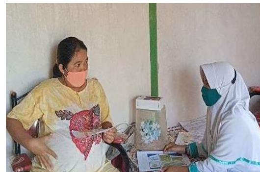
Gambar 2 Pemberian penyuluhan

Penyuluhan tentang proses persiapan persalinan yang aman di era Covid-19 dilakukan melalui pemberian leaflet lalu memberikan kuesioner 10 soal tentang persiapan persalinan. Hal yang disampaikan kepada ibu hamil terkait dengan pentingnya menerapkan protokol kesehatan yang ketat berupa memakai masker, menjaga jarak dan menghindari kerumunan jika sedang berada di luar. Hal lain juga mengenai vaksinasi ibu hamil. Berdasarkan penelitian yang telah dilakukan, kesiapan masyarakat umum di Sulawesi Tengah untuk divaksinasi hanya 35% ( Ichsan et al., 2021 ), sehingga perlu upaya dari bidan untuk terus memberikan edukasi kepada ibu hamil agar mau divaksinasi .