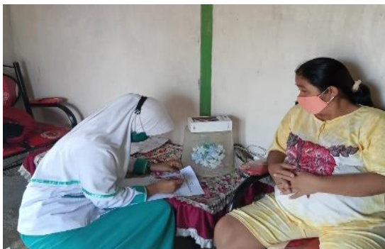
Gambar 1. Pengisian Pretest

Pelaksanaan kegiatan ini menerapkan protokol kesehatan pandemik COVID-19. TIM pengabdian dan peserta wajib menggunakan masker dan sebisa mungkin menjaga jarak. Tempat pelaksanaan di rumah peserta Kegiatan dimulai dengan pembagian kuesioner pre-test seperti terlihat pada Gambar 1 . Setelah pengisian selesai maka dilanjutkan dengan pemberian penyuluhan menggunakan media leaflet seperti terlihat pada Gambar 2 .